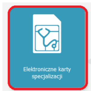
Rysunek 2 Kafelek Elektroniczne karty specjalizacji

Po zalogowaniu w odpowiedniej roli wybierz kafelek 'Elektroniczne karty specjalizacji' .