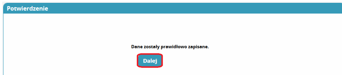
Rysunek 11 Potwierdzenie zapisania danych o zrealizowanych dyżurach medycznych.

Aby zapisać wprowadzone dane o zrealizowanych dyżurach medycznych użyj przycisku 'Zapisz' znajdującego się na dole strony . Po użyciu przycisku 'Zapisz' system zaprezentuje komunikat informujący o poprawności zapisu danych. Komunikat należy potwierdzić przyciskiem 'Dalej' .