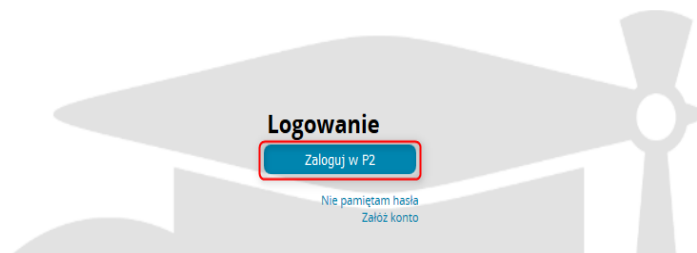
Rysunek 1 Logowanie do SMK